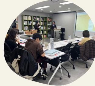
韓国の市民活動を知る