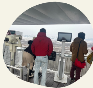
非武装地帯(DMZ)で南北分断を考える