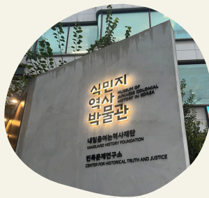
植民地主義の克服と東アジアの平和をめざす