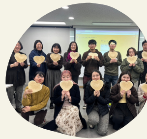
現地の大学生と一緒に学ぶ